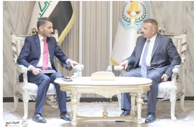
بغداد / المستقبل العراقي

بحث محافظ النجف الأشرف يوسف مكي كناوي، مع وزير الداخلية عبد الأمير الشمري التعاون المشترك في تعزيز أمن المحافظة. وذكر بيان مكتبه، أن «كناوي التقى الشمري بمقر الوزارة لبحث التعاون المشترك بين المحافظة ووزارة الداخلية في تعزيز أمن المحافظة خاصة في الزيارات المليونية والمناسبات الدينية». وأضاف «كما ناقش اللقاء سبل تعزيز الأمن في المحافظة واستقرارها في جميع الفصول، وخلق بيئة جيدة للاعمار والاستثمار».