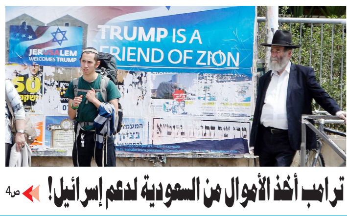
ترامب أخذ الأموال من السعودية لدعم إسرائيل! 4

أيها الناس نافسوا في المكارم وسارعوا في المغامر «الامام الحسين عليه السلام»