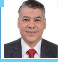
القاضي جعفر كاظم المالكي

يتفق الإثبات العلمي مع الإثبات القضائي في أنه يعتمد على المجهود الإنساني أو العقلي الذي يهدف إلى التحقق من واقعة غير معروفة أو متنازع فيها عن طريق مجموعة متناسقة من الوقائع المعروفة، لكن هناك فرق واضح بين الإثبات القضائي والإثبات العلمي يتعلق بالأشخاص أو المكان أو الوسيلة أو النتيجة.