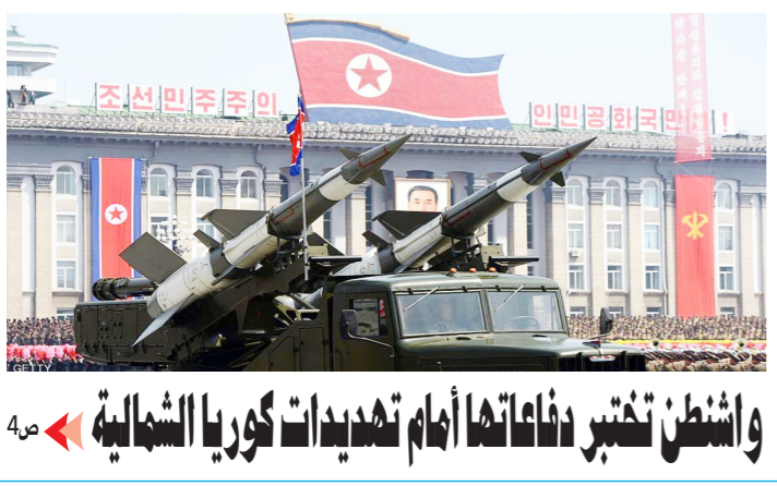
واشنطن تختبر دفاعاتها أمام تهديدات كوريا الشمالية

الكمال كل الكمال التفقه في الدين والصبر على النائية و تقدير المعيشة «الامام الحسين (عليه السلام)»