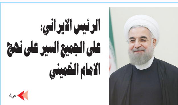
الرئيس الإيراني: على الجميع السير على نهج الامام الخميني