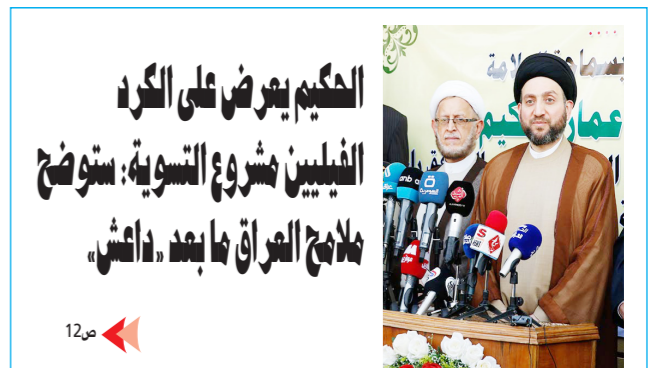
الحكيم يعرض على الكردي الفيليين مشروع التسوية: يتوضح ملاحق العراق ما بعد «داعش»