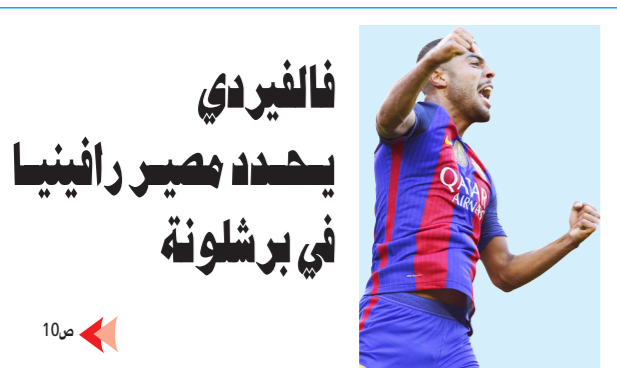
فالفيدي يحدد مصير رافينيا في برشلونة