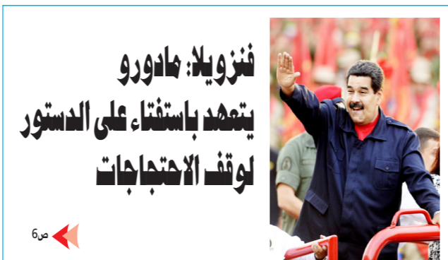
فنزويلا: مادورو يتمهد باستفتاء على الدستور لوقف الاحتجاجات