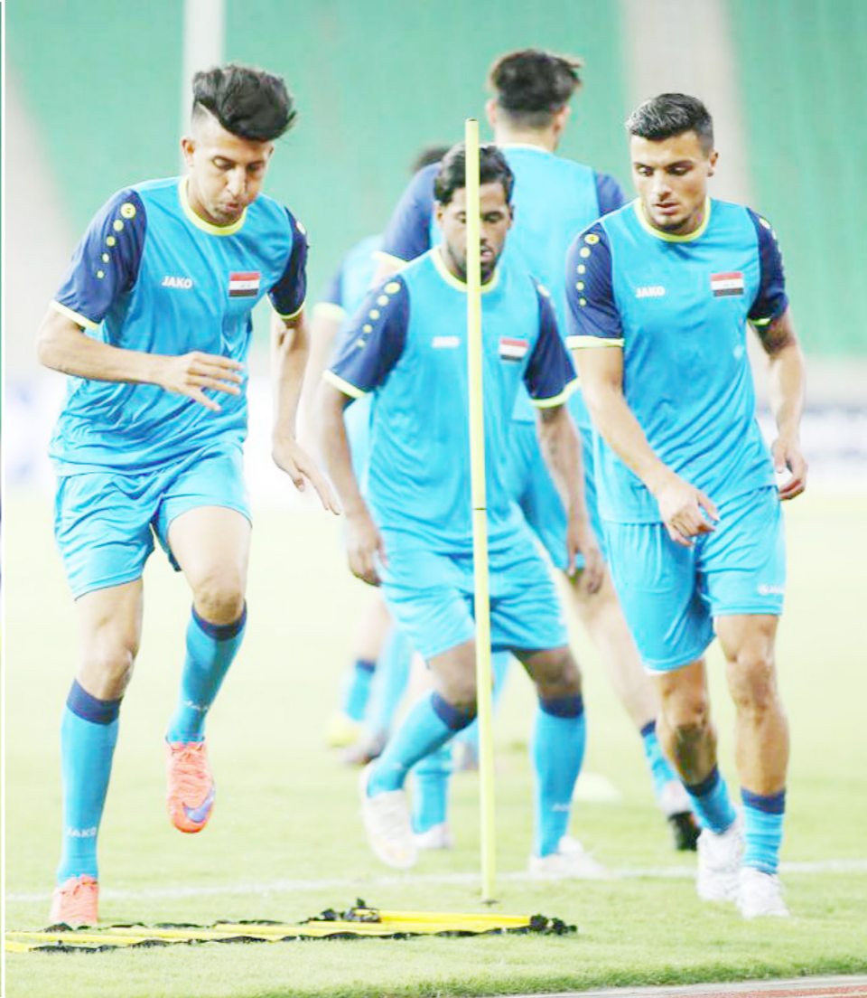
لكننا مطالبون أمام الجماهير باستعادة هوية الفريق، وتحقيق نتائج مميزة. وخاض المنتخب الوطني مباراتين وديتين، بينما تعادل في الثانية (-0) مع كوريا الجنوبية؛ استعداداً للقاء اليابان، بالجولة الثامنة من تصفيات آسيا للمونديال.