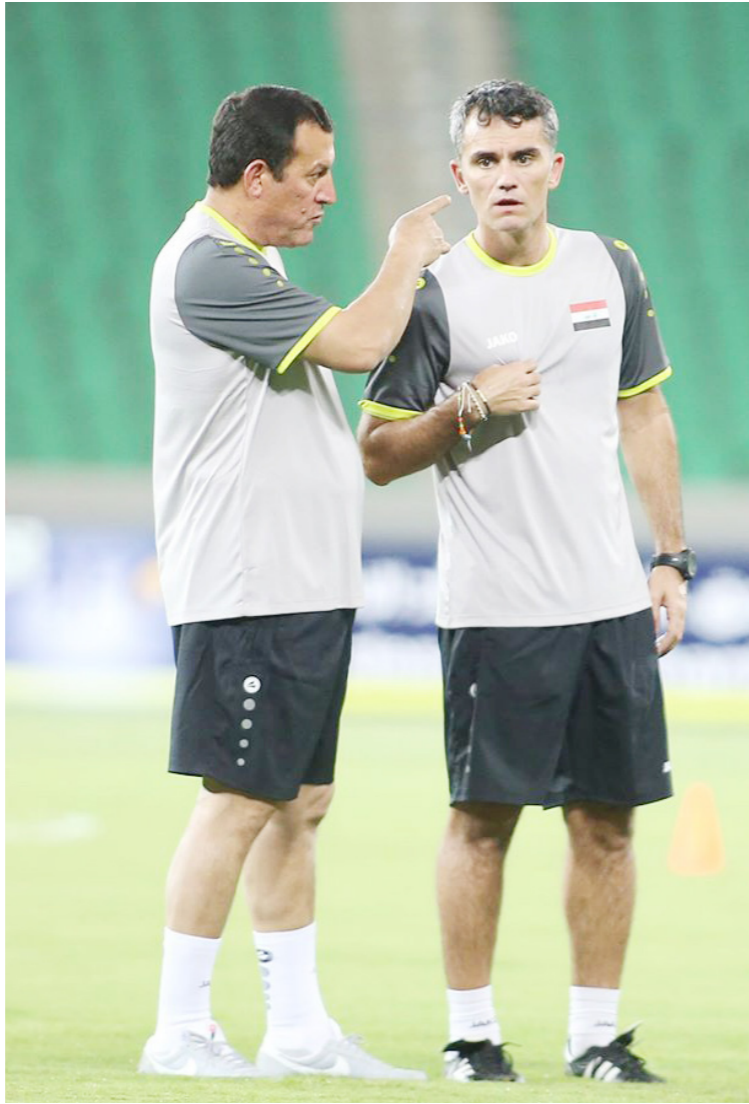
فاز في الأولى على الأردن (-1)، الجنوبية؛ استعداداً للقاء اليابان، بالجولة الثامنة من تصفيات آسيا للمونديال.

يذكر أن العراق استعداداً لمواجهة اليابان، خاض مباراتين وديتين، ففاز في الأولى على الأردن (-1)، بينما تعادل في الثانية (-0) مع كوريا الجنوبية في الإمارات.