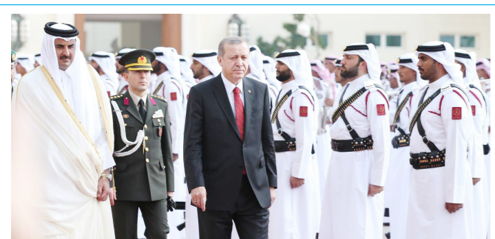
تركيّا تدخل في حندق قطر

من لم يجعل الله له من نفسه واعظاً فإن مواعظ الناس لن تغني عنه شيئاً «الامام الحسين عليه السلام»